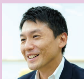
株式会社KDDIエボルバ やまがた特命観光・つや姫大使