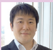
株式会社KDDIエボルバ 山形センター長