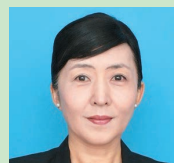
人材育成アカデミーローズレーン 代表